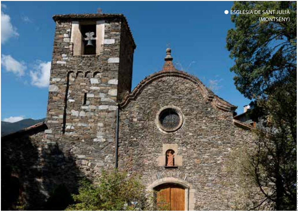
● ESGLÉSIA DE SANT JULIÀ (MONTSENY)