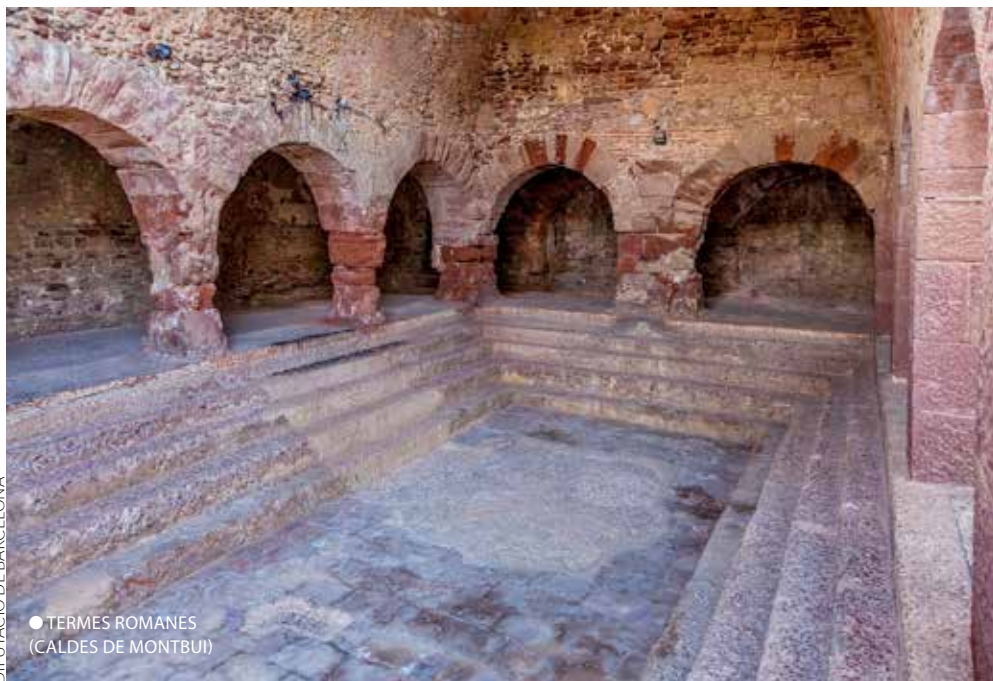
● TERMES ROMANES (CALDES DE MONTBUI)