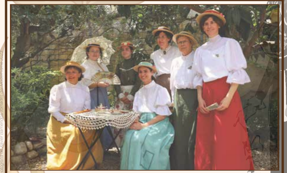
Jornades del Modernisme 2023

7 i 8 de juny de 2024 Patrimoni i indumentària