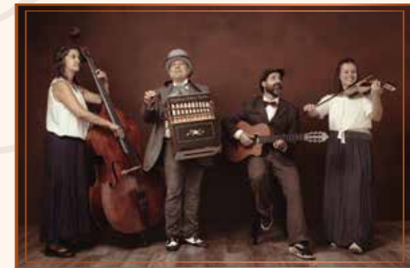
La puntual Folk

Degustació de vins, caves i productes gelidencs a càrrec de Can Pasqual, La Confiança i Mostatxo.